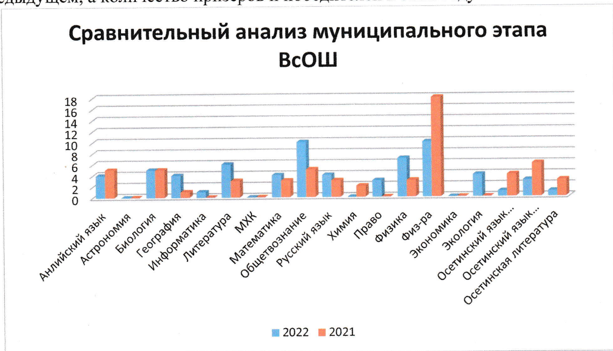
Диаграмма 4. Количество участников муниципального этапа по каждому предмету

Из диаграммы 3 видно: большее количество участия было в 2021-2022 учебном году. В 2021-2022 учебном году количество участия составляло 458, а в 2022-2023 уч.г. – 378, что на 17,5% участия в прошлом году было больше, чем в этом. Связано это с тем, что количество болевших детей в этом году больше, чем в предыдущем, а количество призеров и победителей в этом году больше на 30%