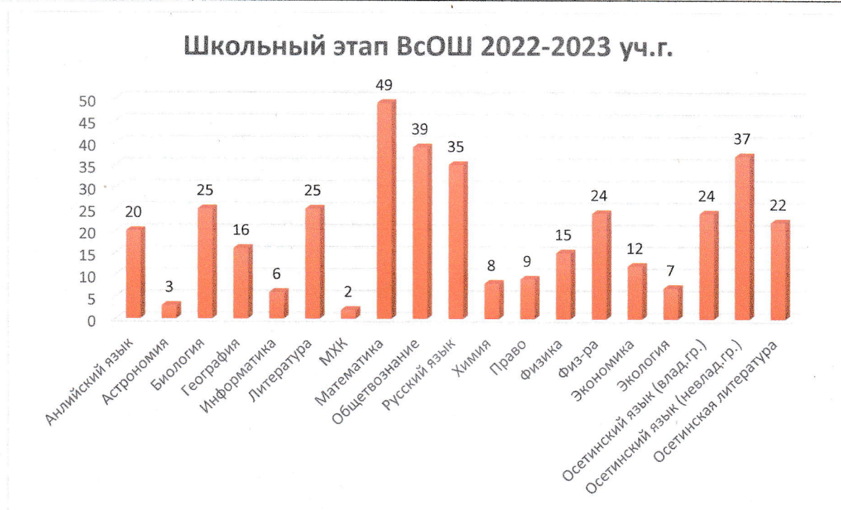
Диаграмма 1. Количество участников школьного этапа по каждому предмету